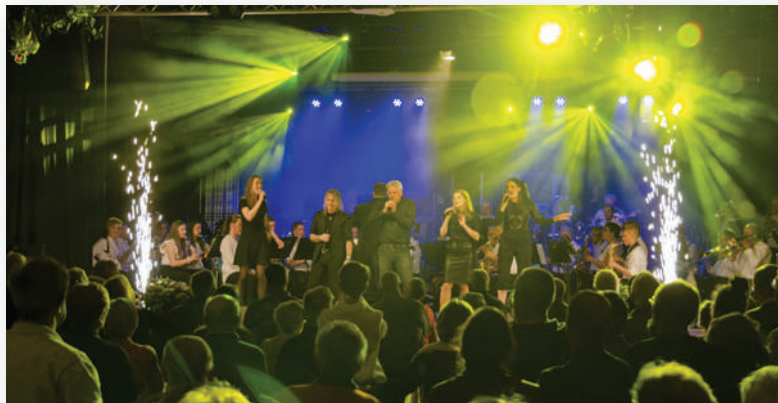
Het concert 'Vrienden van Oelbroeck Live' was in april een ware publiekstrekker in Oelbroeck.

Stefan Theunissen (SPG Photos), alle vrijwilligers