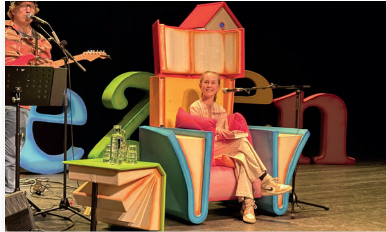
Bibi: “Het is een heel leuk avontuur.”

Meijer is dé topper binnen de toppers! Hij staat bekend om zijn scherpe observaties, onnavolgbare timing en unieke kijk op de alledaagse dingen. Werkelijk moeiteloos weet hij zijn publiek mee te nemen in een rollercoaster van grappen en grollen. Absurde verhalen, gekke capriolen, moderne techniek en ook de eigenaardigheden van de mens. Alles komt voorbij. En steeds weet hij het publiek te verrassen en betoveren. Zijn stijl is brutaal, charmant en betoverend. De avond in Oelbroeck begint om 20.00 uur en de entree is € 15,00.